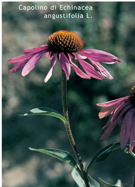
Capolino di Echinacea angustifolia L.

Frutto (cipsela) è secco, indeiscente; seme eretto, con guscio membranoso.